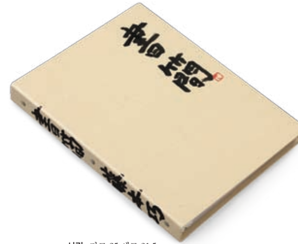
서간 가로 25 세로 31.5 1970년대 한국에서 일본에 있는 가족들에게 보낸 엽서 및 편지 등을 정리한 편지철