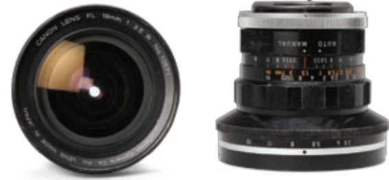
렌즈 길이 7.8 지름 8.4 1981년에 구입하여 사용한 캐논(Canon) 19mm 광각 렌즈