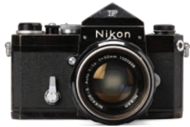
카메라 높이 9.5 너비 15 길이 14.5 Nikon F 모델로, 후지모토 다쿠미가 1971년에 구입하여 1981년까지 사용한 카메라