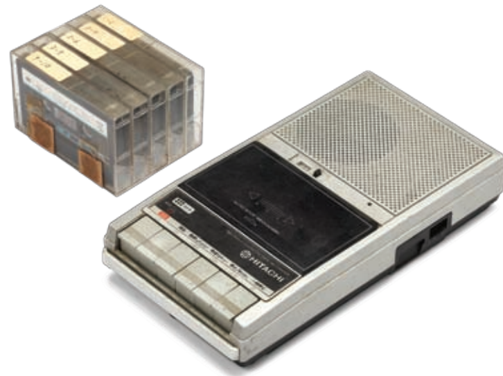
녹음기 및 녹음테이프 가로 13.5 세로 26.5 높이 5 가로 11 세로 7 두께 1.8 1980년대 한국 여행 때 사용한 녹음기 및 음성을 기록한 녹음 테이프