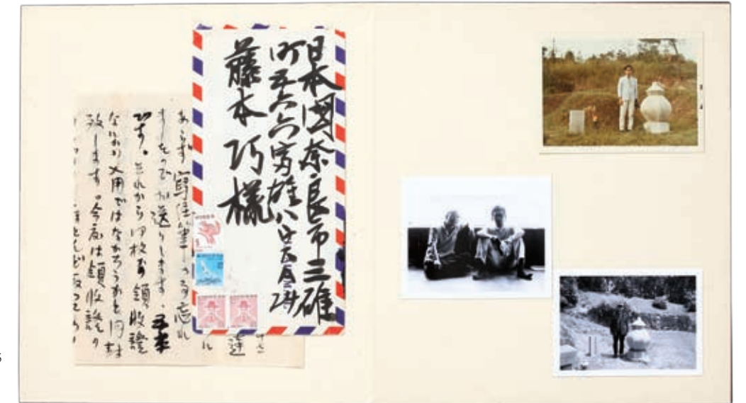
석도륜 관련 자료첩 가로 533.5 세로 27.5 석도륜의 가르침을 마음에 새기기 위해서 정리한 자료첩